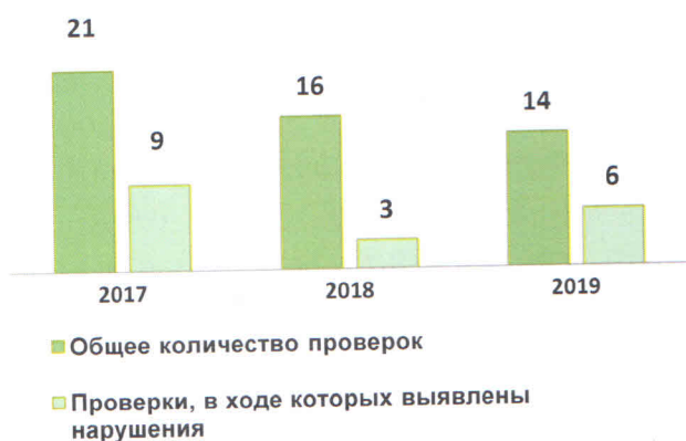
Количество проведенных проверок

Учитывая ключевые цели приоритетной программы «Реформа контрольной и надзорной деятельности», предусматривающие снижение административной нагрузки на организации и граждан, осуществляющих предпринимательскую деятельность, и повышение качества администрирования контрольно-надзорных функций, в том числе путем внедрения системы профилактики нарушений, ежегодно снижается количество проводимых проверок.